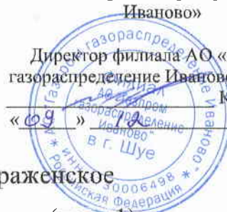
Схема газоснабжения с. Преображенское Южского муниципального района (лист 1)